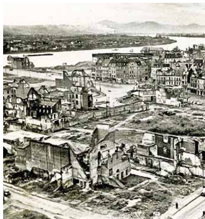
Bonn 1950: Nur der Rhein und das Siebengebirge lassen erahnen, dass es sich um die Bonner Ruinen handelt.