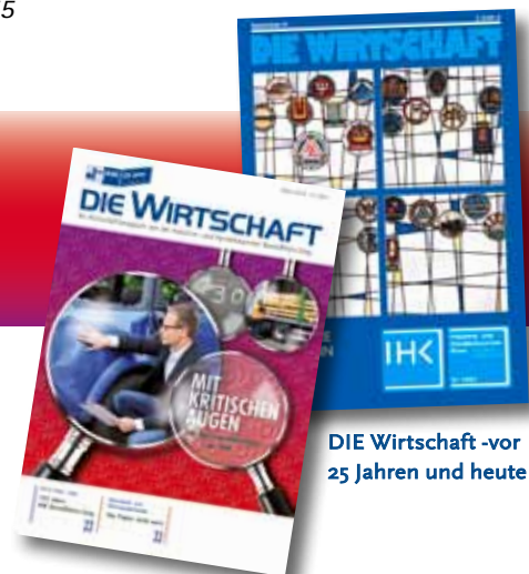
DIE WIRTSCHAFT - vor 25 Jahren und heute

Tel.: 02236 3278040 | r.vogel@carthaus.de | www.carthaus.de/ihk