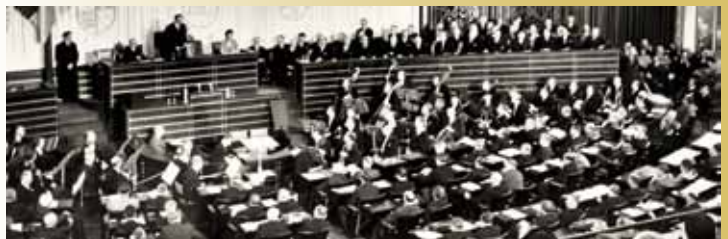
Am 7. September 1949 trat in der Pädagogischen Akademie Bonn der erste deutsche Bundestag zusammen.

Der Parlamentarische Rat entscheidet in geheimer Abstimmung, dass Bonn „der vorläufige Sitz der Bundesorgane“ wird. Frankfurt unterliegt mit 29 zu 33 Stimmen.