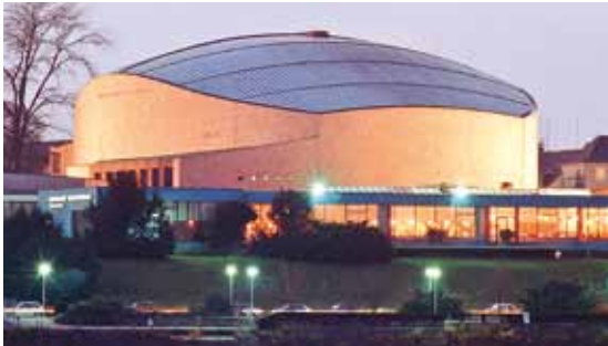
Die 1959 eröffnete Beethovenhalle