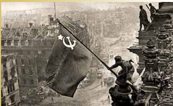
Soldaten hissen die sowjetische Flagge auf dem Reichstag in Berlin

Industrie- und Handelskammer für eine starke Wirtschaft Bonn/Rhein-Sieg