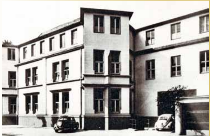
IHK-Gebäude Schumannstraße in Bonn

Die IHK Bonn wird wieder gegründet. Die Mitarbeiter nehmen in der Schumannstraße 4 – 6 an fünf geretteten und fünf geliehenen Schreibtischen ihre Arbeit auf.