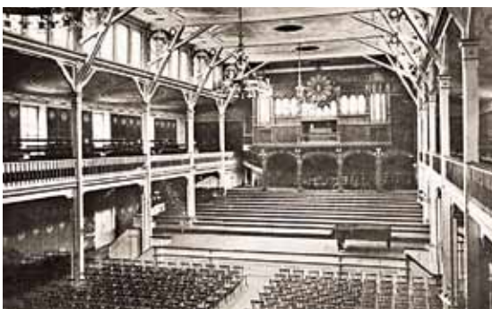
Konzertsaal der im Zweiten Weltkrieg zerstörten Beethovenhalle.

„Bonn könnte das werden, was Salzburg seit langem ist, nämlich jene heilige Stätte, zu der hinzupilgern eine Welt nicht müde würde. Bonn könnte, wenn es wirklich und ernstlich wollte, die musikalische Hauptstadt der Welt werden.“ Dieses Zitat stammt nicht etwa aus dem Jahr 2015, als Bonn über den Bau des Beethoven-Festspielhauses stritt und die Befürworter die Mozart-Stadt Salzburg als Vorbild nannten. Nein, es stammt aus dem Jahr 1954 und ist von Dr. Hermann Alef, Hauptgeschäftsführer der IHK Bonn/Rhein-Sieg (s. Artikel „Streitbarer Charakter“). Bonn stritt über den Standort für die neue Beethovenhalle. Ihre Vorgängerin war im Zweiten Weltkrieg dem Erdboden gleichgemacht worden.